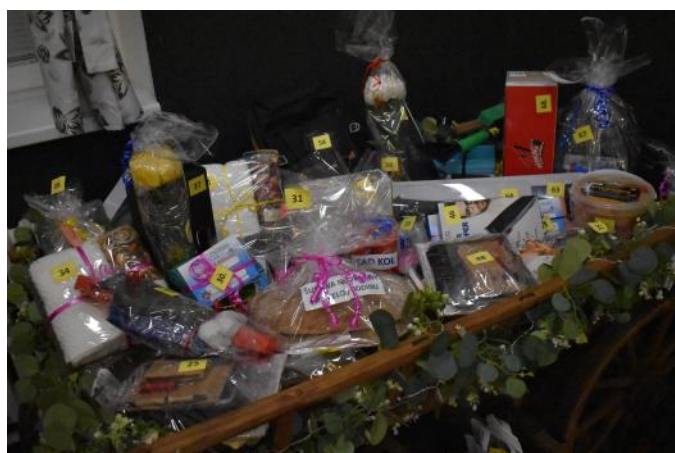
Výhry byly opravdu rozmanité