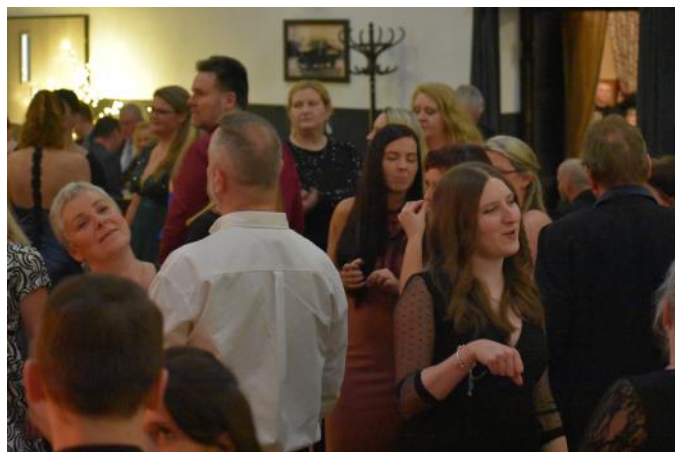
Na tanečním parketu bylo stále plno

hrdina oblíbeného filmu nebo přímo jako držitel Oscara na červeném koberci. Výběr byl vsutku rozmanitý a výsledky mnohdy předčily fantazii aktérů.