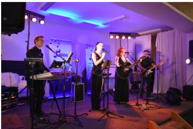
Skupina MANE hrála opravdu famózně