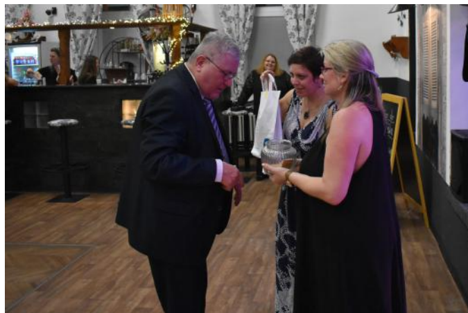
Každý výherce losoval výherce následujícího