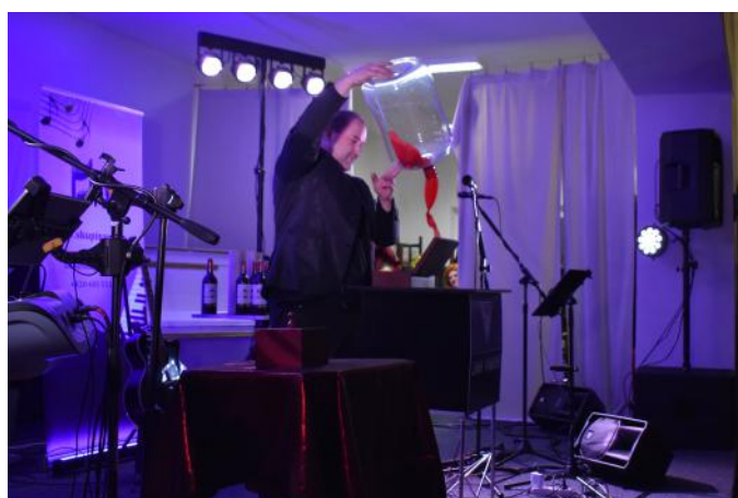
Pan kouzelník v akci