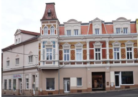
dům č.p. 58 a 59 na Mírovém náměstí