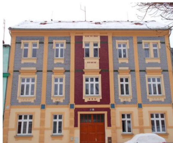
dům č.p. 20 na Tržním náměstí

Nejnámější ze synů byl Karl, který byl zdatným obchodníkem a pokračoval v textilním podnikání svého otce. V paměti spoluobčanů, kteří ho znali před rokem 1938, utkvěl díky své přívětivosti. Populari-