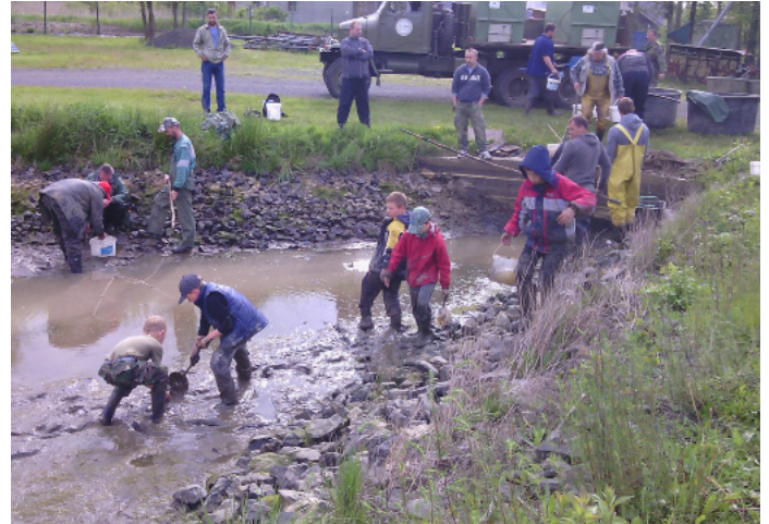
Naše děti v akci.

Děti měly radost a rodiče to taky ve zdraví přežili. Hospodář zářil spokojeností, tak doufáme, že to nebyl náš poslední výlov. Za odměnu jsme dostali několik štik pro náš malý revír Hradčák. Na podzim už by děti mohli některou ulovit třeba na třpytku.