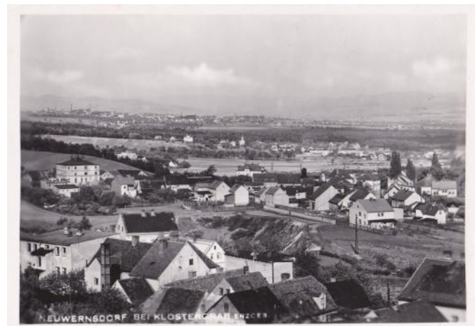
Nové Verneřice – pohled ze sbírky p. Davidka

V Mlýnech, Verneřicích a Křižanově žádné ulice či náměstí pojmenované nejsou. V Křižanově a Verneřicích můžeme mluvit o jakési návsi v centru obcí, které bývaly samostatné, Křižanov do roku 1950, Verneřice do roku 1954.