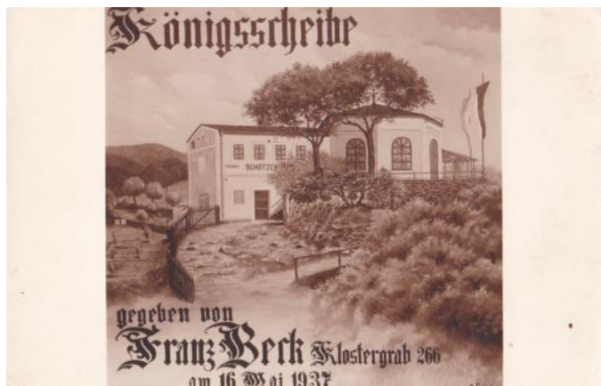
Královská výšina – pohled ze sbírky pana Davidka

Hřiště v Křižanově dokazuje úsilí dělnické tělovýchovy o zajištění vhodných cvičebních prostor. 14. 9. 1923 byl Městským úřadem v Hrobě přidělen Federované dělnické tělovýchovné jednotě /FDTJ/ a Tělovýchovné jednotě německé sociální demokracie /ATUS/ pozemek na hranici Hrobu a Křižanova. Členové obou tělovýchovných jednot za těžkých terénních podmínek vybudovali toto hřiště v Křižanově (je ve skutečnosti na katastrálním území Hrobu) a společně je