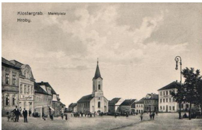
Tržní náměstí - pohled ze sbírky p. Davidka

Začneme nejstarší částí a to je Tržní náměstí které, asi měnilo název nejméně, od historického Marktplatz (Tržního náměstí) přes Rudé náměstí zpět k Tržnímu. Z náměstí vycházelo několik ulic asi nejstarší dnes již neexistující byla ulička vedoucí od staré radnice okolo pivovaru k zboženišti a jmenovala se Bräuhausgasse (Pivovarská ulička). Ve spodní části se Tržní náměstí napojovalo na Duxerstrasse (Duchcovskou ulici). Další ulice vedla okolo školy a jmenovala se Schulgasse (Školní ulička) nyní Komenského ulice. Poslední, která vedla k nádraží se jmenovala Bahnhofstrasse Nádražní nyní Horní ulice.