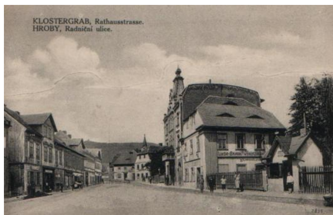
Radniční ulice od radnice – pohled ze sbírky p. Davidka

Druhé náměstí se nejčastěji jmenovalo Karlsplatz (Karlovo náměstí) nebo v 50letech náměstí Dr. Edvarda Beneše, v současné době Mírové náměstí. Z něho vede ulice směrem na Verneřice dnes Teplická dříve Johannesstrasse nebo Janova ulice či také Neuwerndorstrasse, požívali se různé názvy podle doby. Z Mírového náměstí na sever vede ulice směr Mlýny dříve Nordstrasse později Koněvova a nyní Mlýnská.