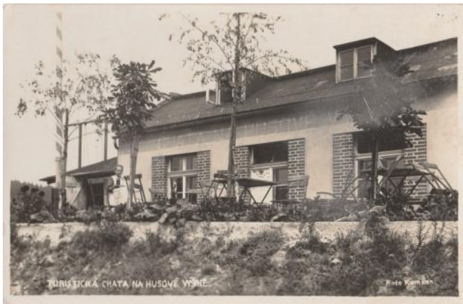
Chata na Husově výšině – pohled ze sbírky pana Davidka

Husova výšina nazývána Husovka název získala až po první světové válce, dříve Galgenerg, Šibeniční vrch s části zalesněn, kde se nachází osada S.T.O. Dříve tam též stávala turistická chata. A býval tam kamenolom.