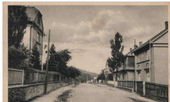
Sadová ulice – pohled ze sbírky p. Davidka

V Mlýnech, Verneřicích a Křižanově žádné ulice či náměstí pojmenované nejsou. V Křižanově a Verneřicích můžeme mluvit o jakési návsi v centru obcí, které bývaly samostatné, Křižanov do roku 1950, Verneřice do roku 1954.