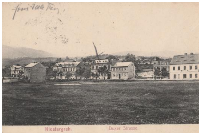
Duchcovská ulice – pohled ze sbírky p. Davidka

Z ulice též odbočovala cesta ke hřbitovu značená jako Friedhofsweg (Hřbitovní cesta). Z Duchcovské ulice také odbočovala u radnice ulice Giselastrasse, nebo Verneřická, podle toho, že vedla původně do Verneřic, později Václava Klímy, ulice se dnes jmenuje U Radnice.