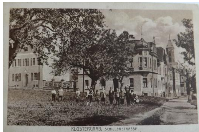
Shillerstrasse (Rybníční ulice)

vznikla jako družstevní výstavba v letech 1930 – 32 a nesla název Masarykova a později Fučíkova a současné době se jmenuje Sadová.